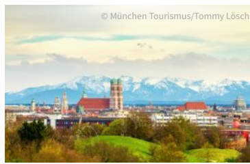
München und die Alpen