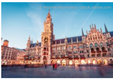
Am Marienplatz in München