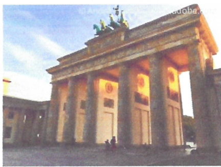
Brandenburger Tor in Berlin